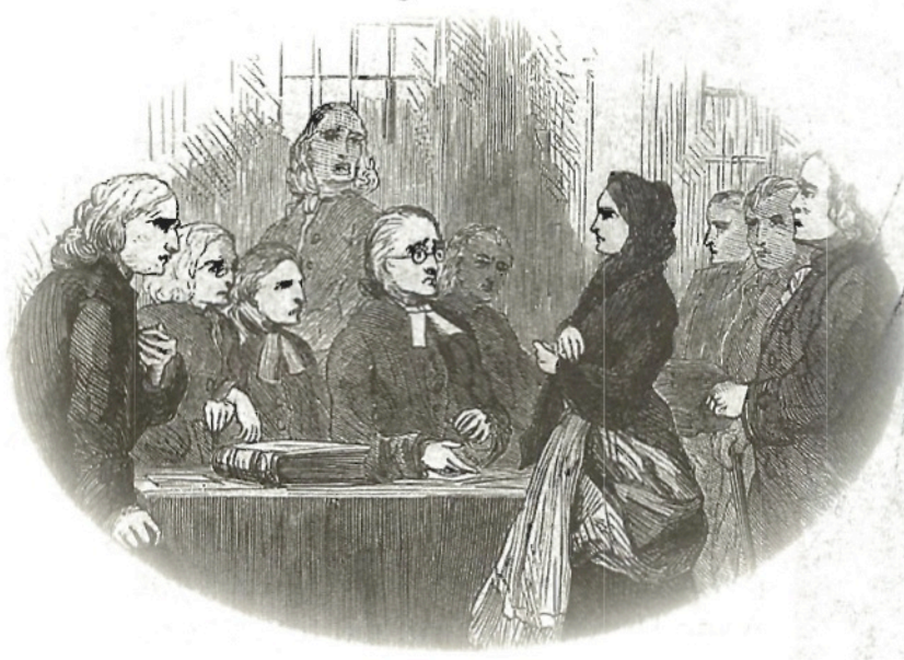
Anne Hutchinson stood up for her beliefs about religion.

後來，她的想法改變了，她認為信念(faith)比遵守教會的一些規定還重要。她冒險告訴別人她對宗教信仰的想法。冒險(risk)就是雖然知道可能會有不好的事情發生，但是仍然勇敢地去做。跟她在在一起的人不喜歡她的新想法，而且不要她說出來。所以他們終於在1637年把她趕走。今天有些人覺得 Hutchinson 是一位很勇敢的英雄(hero)。